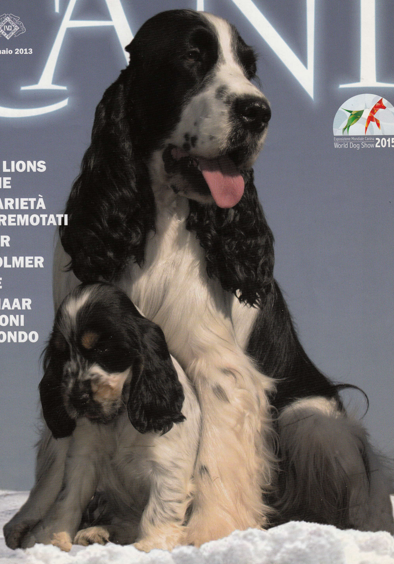
Spedizioni in abbonamento postale - D.L. 353/2003 (conv. in L. 27/02/2004 n. 46) Art. 1 comma 1, 10/MI - N. 1 gennaio 2013

ENCI E LIONS INSIEME SOLIDARIETÀ AI TERREMOTATI COCKER BROHOLMER KELPIE KURZHAAR CAMPIONI DEL MONDO